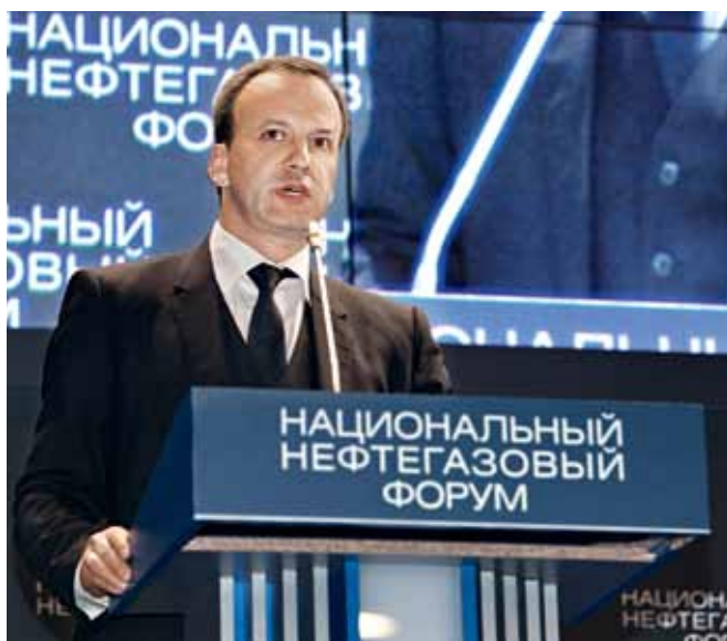
Выступление заместителя Председателя Правительства РФ Аркадия Дворковича перед участниками III Национального нефтегазового форума

тивные экспозиции компаний, входящих в состав госкорпораций "Ростех" и "Росатом".