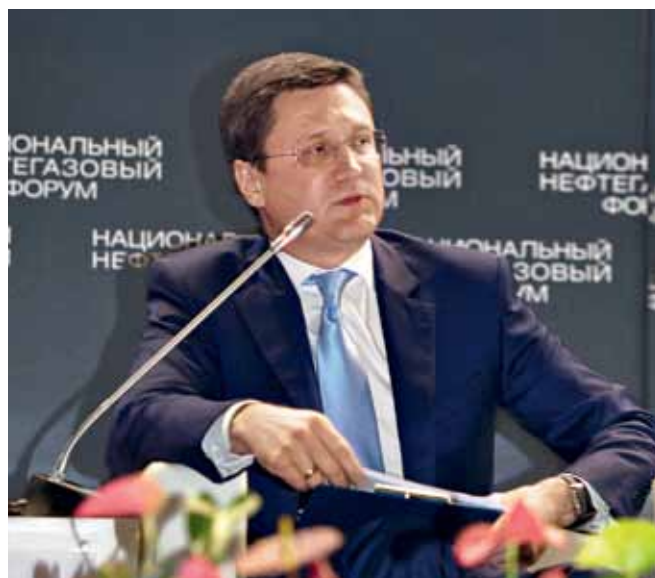
В работе III Национального нефтегазового форума принял участие министр энергетики РФ Александр Новак

Значимым мероприятием саммита стал круглый стол "Нефтегазовый БРИКС: инвестиции,